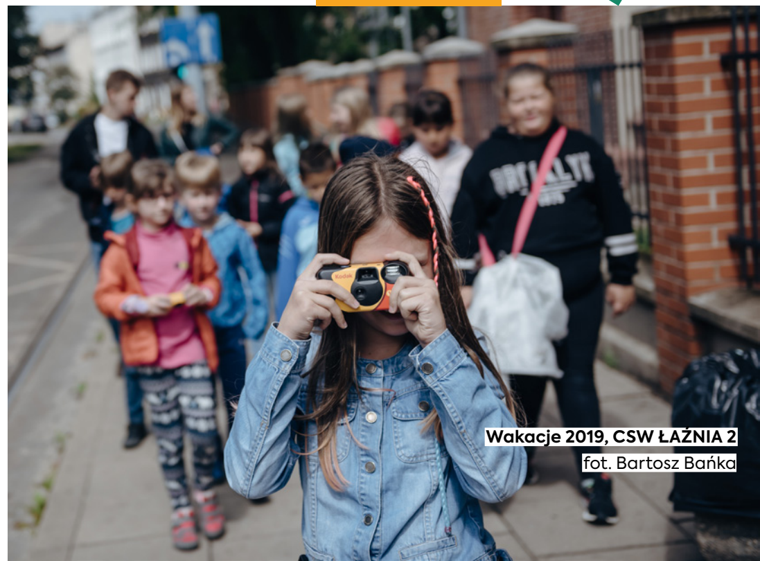
Wakacje 2019, CSW ŁAZNIA 2 fot. Bartosz Bańka