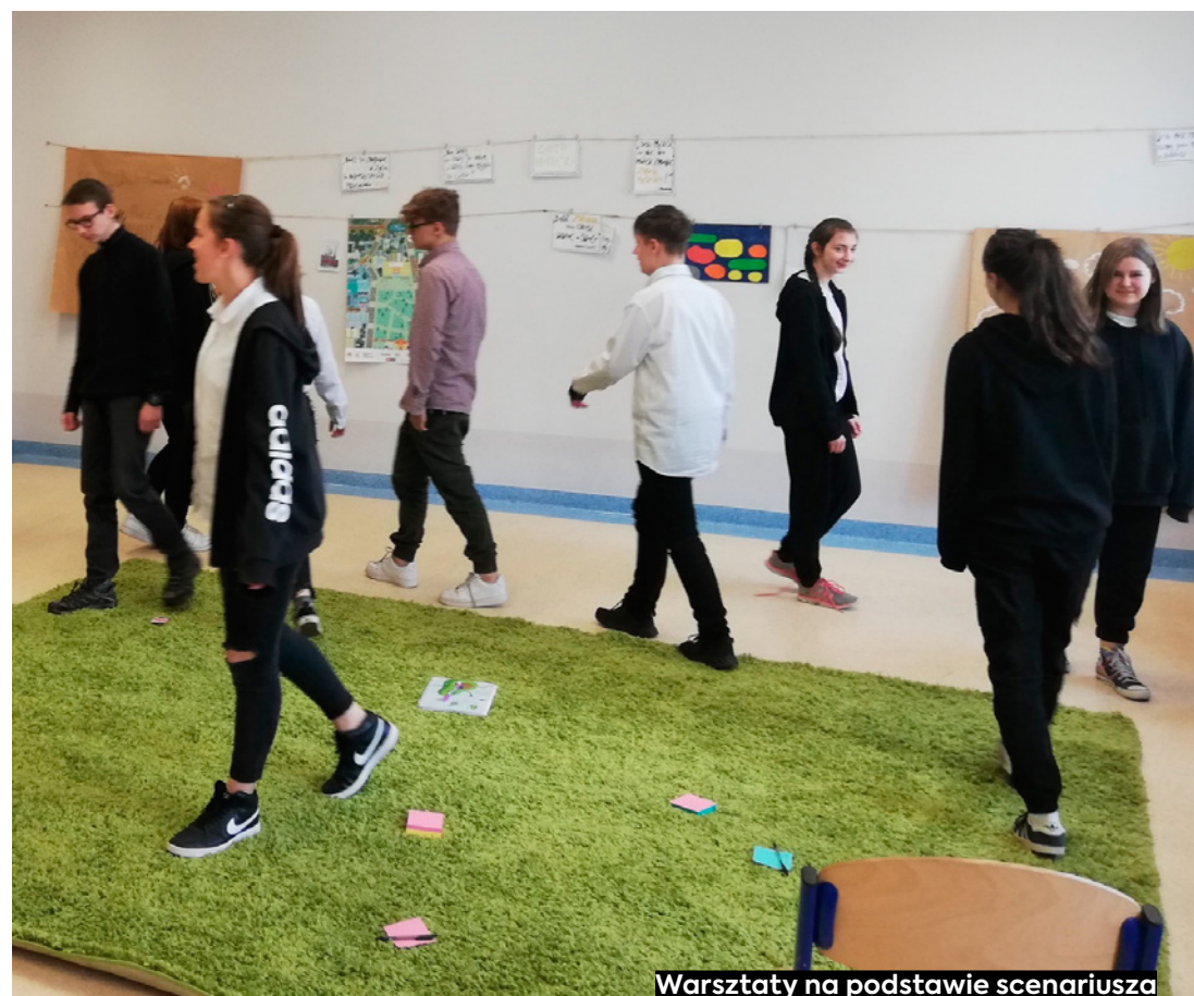
Warsztaty na podstawie scenariusza o tańcu w SP 49 w Gdańsku