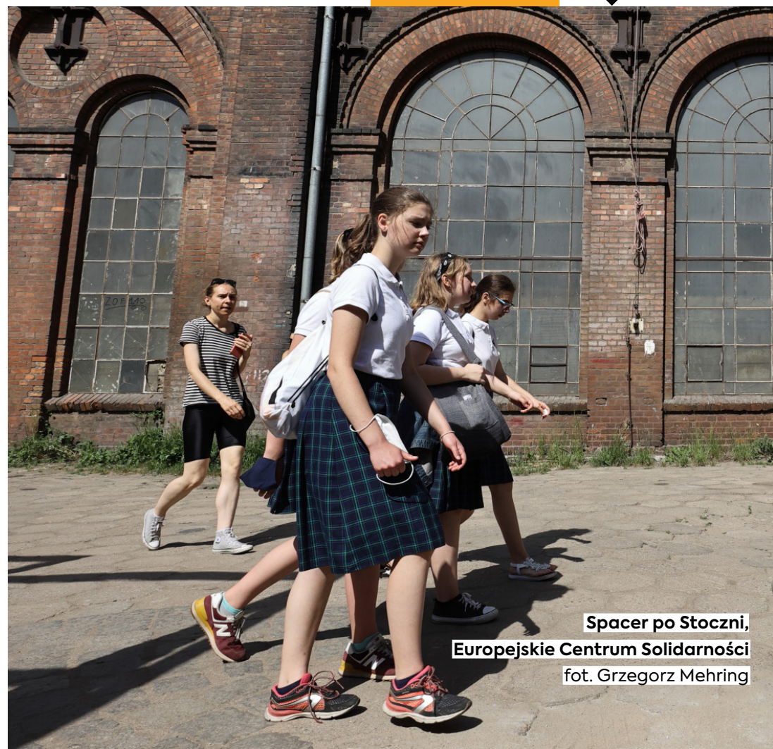
Spacer po Stoczni, Europejskie Centrum Solidarności