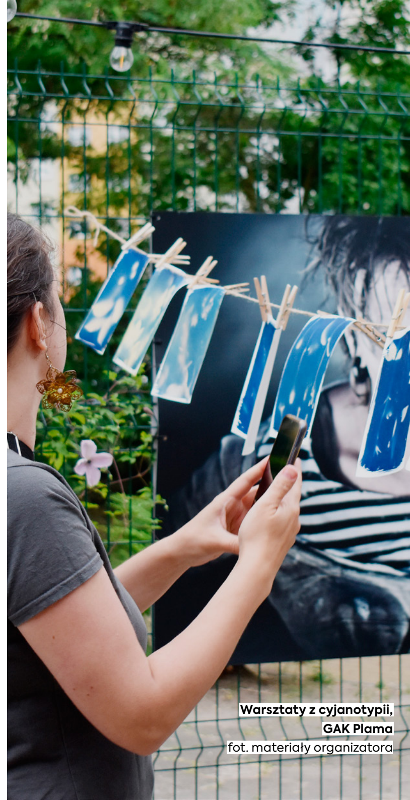
Warsztaty z cyjanotypii, GAK Plama