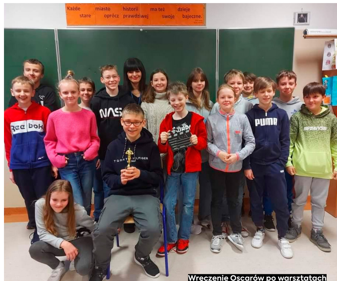
Wręczenie Oscarów po warsztatach filmowych w SP86 w Gdańsku.